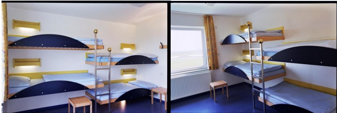
Beispielzimmer Dünenhaus Standard mit festem Stockbetten