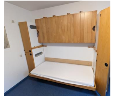
mit hochklappbaren Stockbett