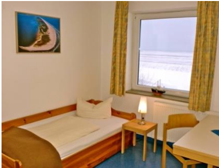
Deichhaus / Dünenhaus Premium